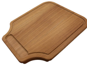
Tagliere in legno Iroko 8647 000